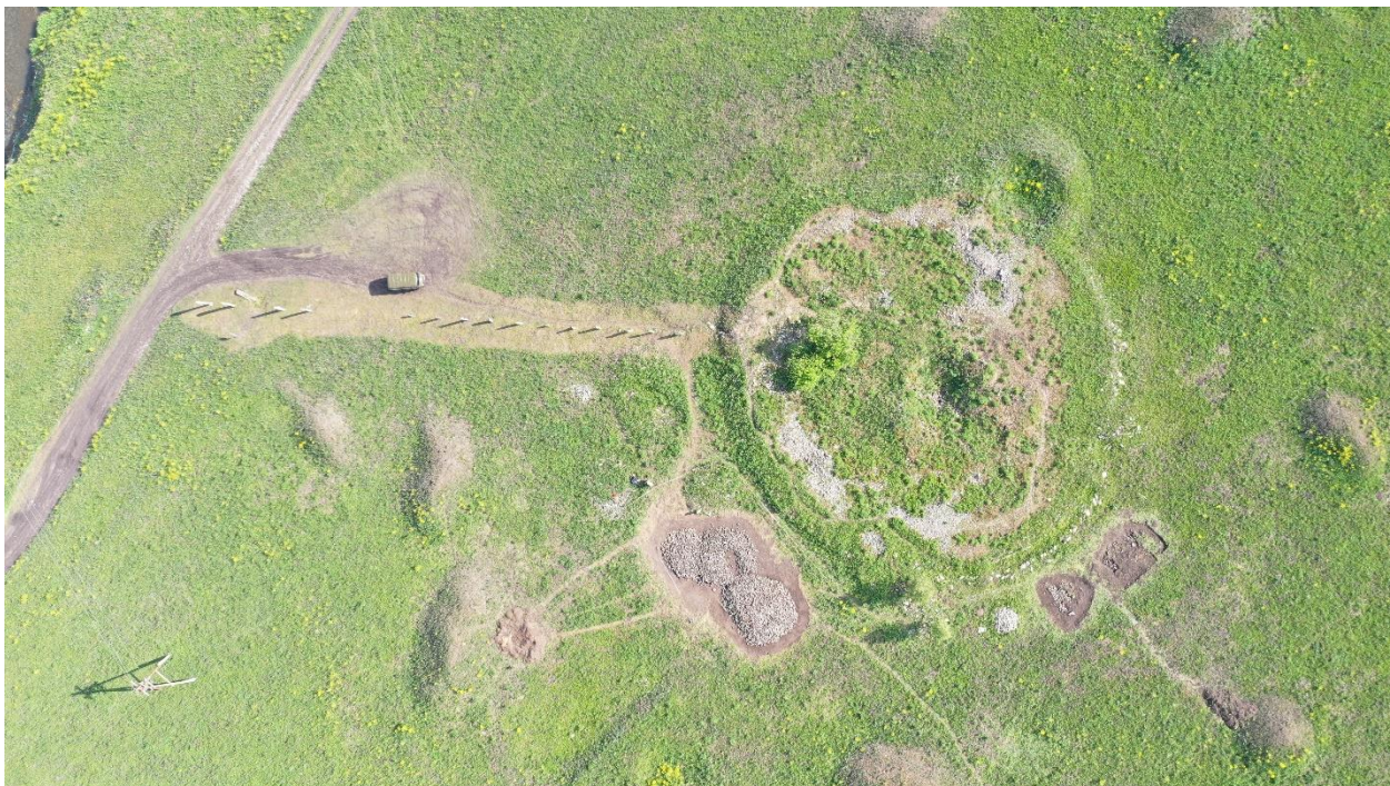
Рис. 3. «Элитный» курган в долине р. Сентелек (Урочище Балчикова 3) в Чарышском районе Алтайского края 1 .

Вторую группу объектов археологического наследия можно рассматривать как потенциально перспективную в туристическом использовании и формировании положительного имиджа региона. К таким объектам относится курганный могильник Урочища Балчикова 3, расположенный недалеко от с. Сентелек в Чарышском районе Алтайского края (Рис. 3). В информационном поле этот памятник известен как «Царский курган в с. Сентелек».