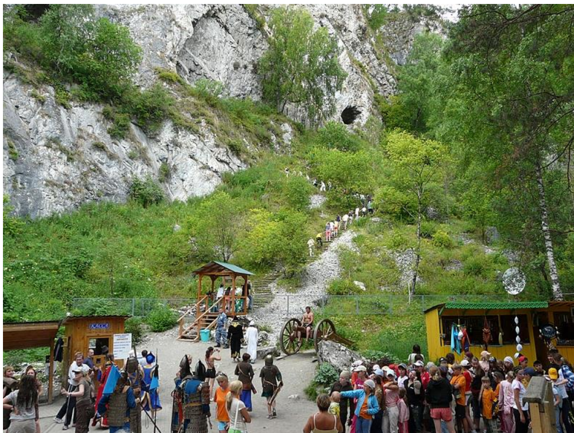
Рис. 2. Историко-археологический парк под открытым небом «Перекресток миров» в Алтайском районе Алтайского края 1 .

Парк расположен на территории особой экономической зоны «Бирюзовая Катунь», в ней организованы территория «молодежного экстрима» и зона для семейного отдыха с проживанием в категориях «премиум» и «эконом». Созданная туристическая инфраструктура в совокупности с транспортной доступностью (комплекс расположен фактически на федеральной трассе Чуйский тракт – основной транспортной артерии Горного Алтая) обеспечивает большой приток туристов в летний сезон. Формирование положительного туристического имиджа Алтайского края посредством презентации данного проекта осуществлялось в рамках всероссийских и международных выставок (например, в экспозиции на международной выставке «Интермаркет-2007–2013») 2 .