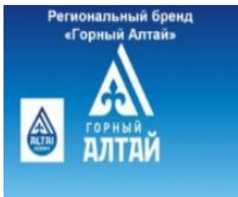
Рис. Товарный знак

Таким образом, в последние десятилетия было сделано очень много для того, чтобы весьма разнообразное и многогранное историко-культурное наследие Республики Алтай играло все более заметную роль в формировании положительного имиджа региона.