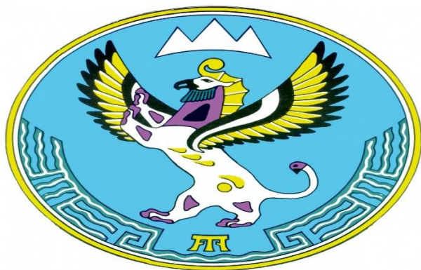
Рис. 2. Герб Республики Алтай

чистоты, неба, гор, рек и озер Алтай. Белые полосы олицетворяют вечность, стремление к возрождению, любви и согласию народов Республики Алтай.